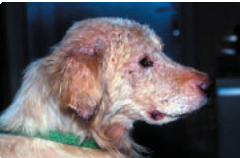
Hund mit Leishmaniose (li.), Malteser mit Augentzündung (re. oben) und Spulwürmer im Dünndarm (re. unten)

Zoonosen wie Tollwut, Leishmaniose und Toxoplasmose gefährden Mensch UND Tier, Parasiten (Babesien, Spulwürmer, Bandwürmer etc.), bakterielle (Borelliose, Leptospirose, Salmonellose etc.) und virale Erkrankungen (Tollwut, Staupe, Parvovirose etc.) stellen ernstzunehmende Bedrohungen auch für andere Hunde dar.